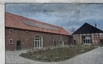
Ein Ort für besondere Künstler: das Kunstforum Buddemühle.